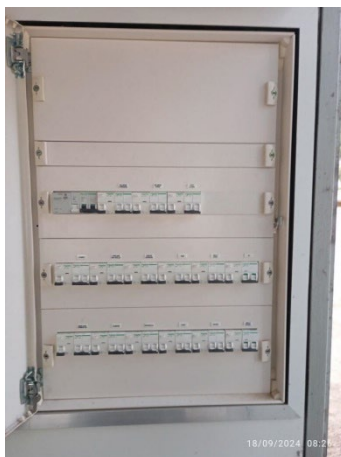
Imatge 2 Quadre elèctric (a verificar amb les seves línies)