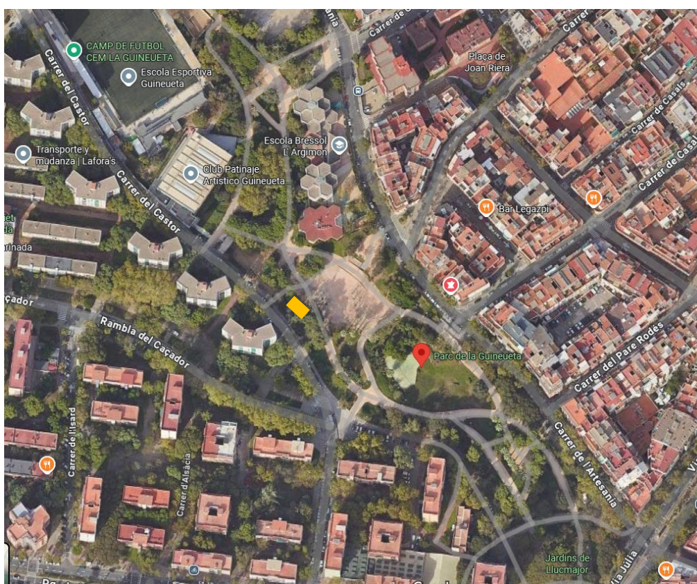
Imatge 1 Emplaçament de la Guingueta