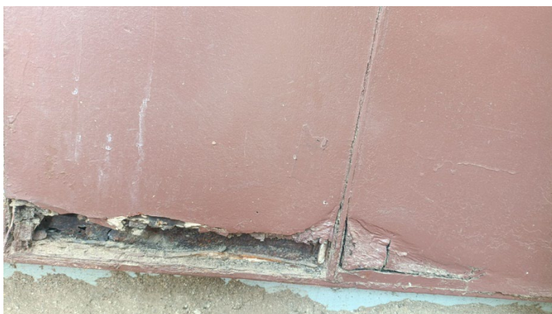
Imatge 3 sòcol exterior inferior amb la fusta podrida